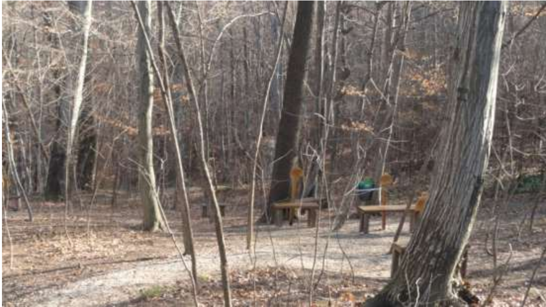
Slika 2: Energetske točke v Hošnici pozimi samevajo.