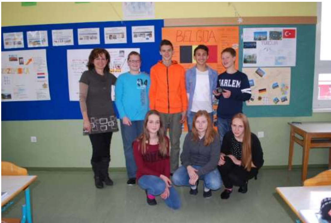
Slika 6: Člani turističnega podmladka snujemo nove ideje

Podmladkarji ugotavljamo, da imamo dobre temelje za razvoj turizma v Laporju. Ledino na tem področju je zaoralo Turistično društvo Laporje, ki je v preteklih letih pripravilo in izvedlo vrsto odmevnih dogodkov in prireditev. Toda večina prireditev je namenjena starejšim turistom, za nas mlade pa niso tako zanimive. Mladi si želimo turizem, ki bo nekoliko drugačen, bolj razgiban in obarvan z dejavnostmi, ki jih imamo radi. In ravno takšne vrste je naš pustolovski tabor v naravi. Menimo, da bi lahko na tem področju naredili še več v smislu organiziranja raznolikih turističnih dejavnosti za mlade. Manjka nam predvsem glasbeno in športno obarvanih dogodkov.