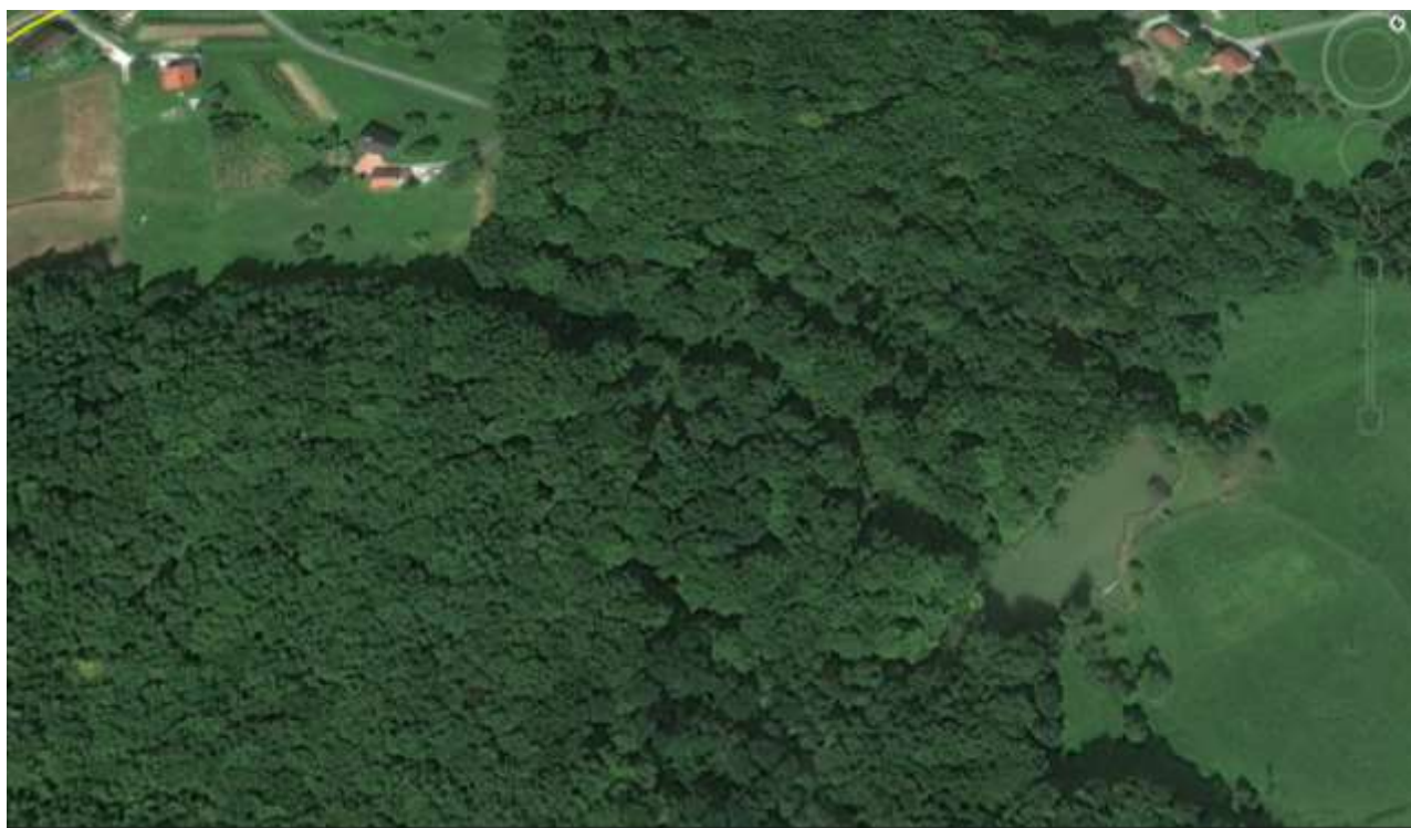
Slika 1: Ačkov ribnik s ptičje perspective.

V južnem delu Laporja leži idilični Ačkov ribnik, kraj, kjer bomo postavili naš tabor.