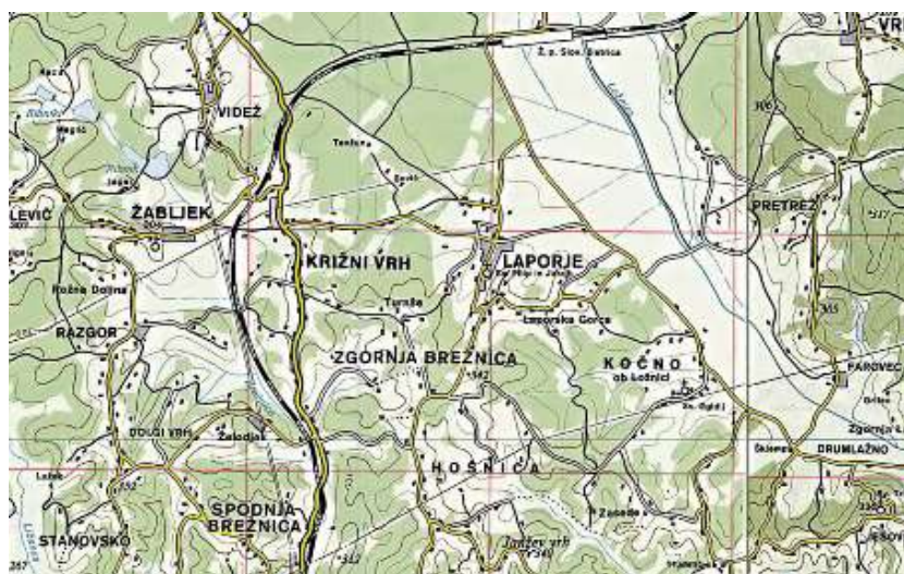
Slika 4: Laporje leži na prometno ugodni legi.

Laporje leži na prometno zelo ugodni legi, le 4 km oddaljeno od avtocestnega izvoza Slovenska Bistrica – jug. Do Laporja je mogoče priti po dveh magistralnih cestah. Prva nas vodi mimo železniške postaje v Slovenski Bistrici, druga pa skozi Križni Vrh, od koder je do Laporja še dva kilometra. Laporje je dostopno tudi po lokalni cesti Poljčane – Hošnica. Ugodna pa je tudi železniška povezava, saj ga od Železniške postaje Slovenska Bistrica ločita le dva kilometra.