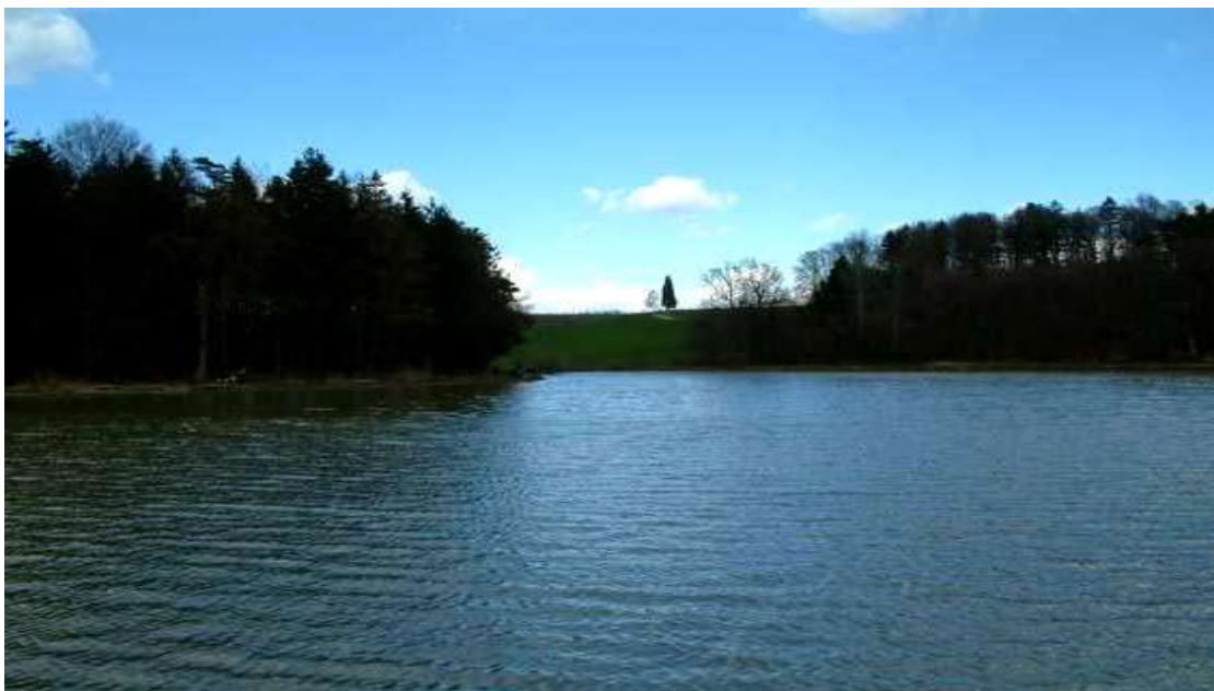
Slika 3: Pogled na ribnik v Krajinskem parku Žabljek.