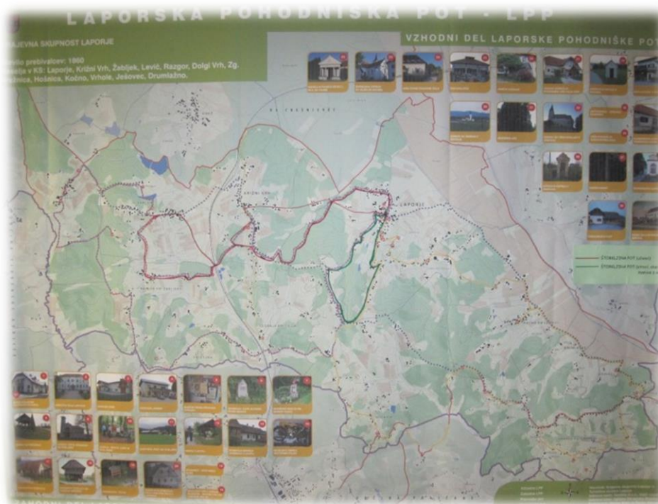
Slika 5: Zemljevid LPP z označeno Štorkljino potjo

Zelena , lažja pot, namenjena otrokom vrtca, starejšim in mamicam z vozički, teče v smeri od šole proti središču, do križišča s cesto za Križni Vrh, v naslednjem križišču pa se vzpne po hribu do Hošnice, kjer zavijemo desno nazaj proti Laporju. (TP, 2016)