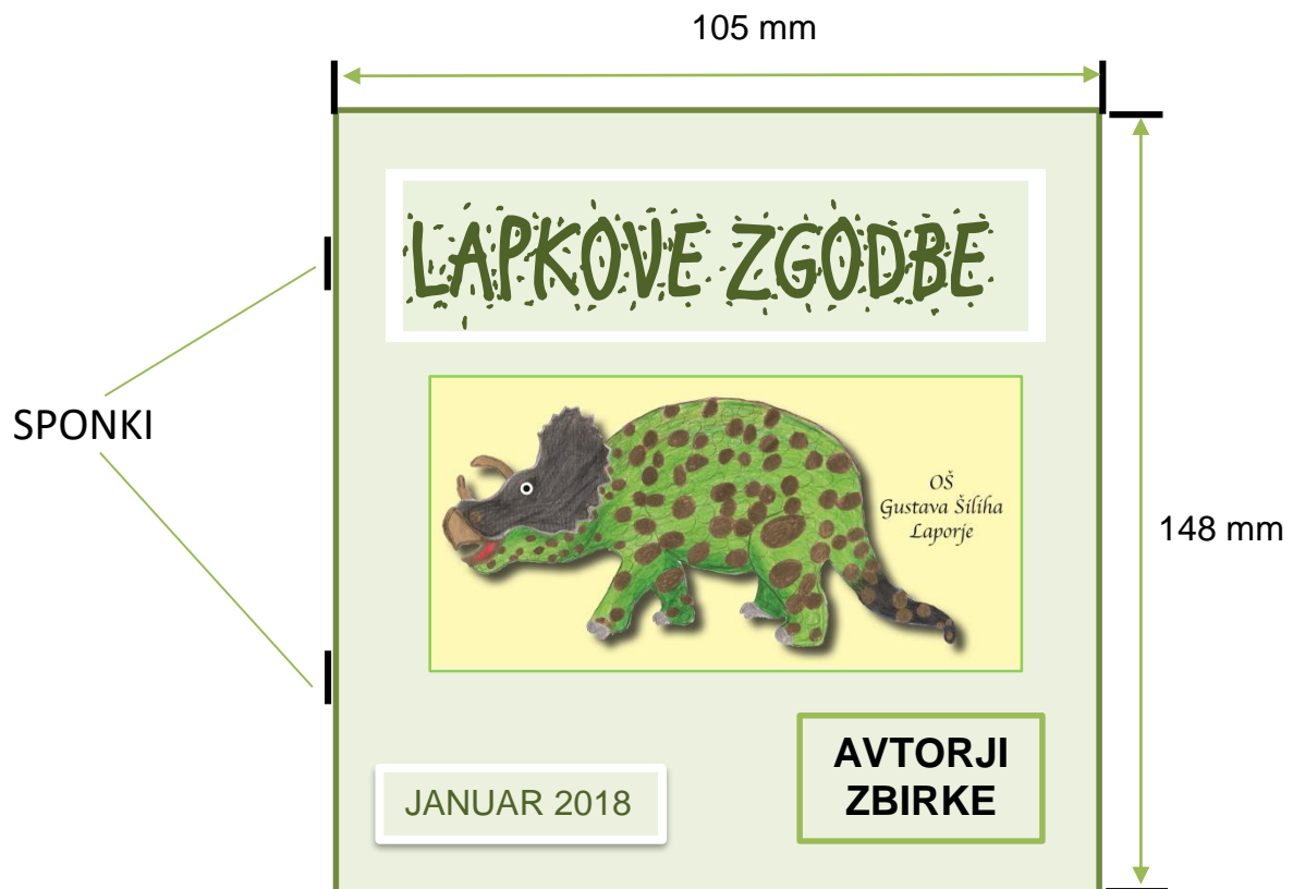
Slika 6: Oris zbirke Lapkove zgodbe

Pod naslovom bo maskota Lapka in navedeni avtorji zbirke, člani turističnega podmladka in mentorica ter datum nastanka zbirke.