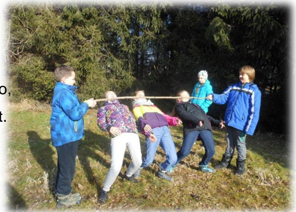
Slika 7: Gozdni limbo