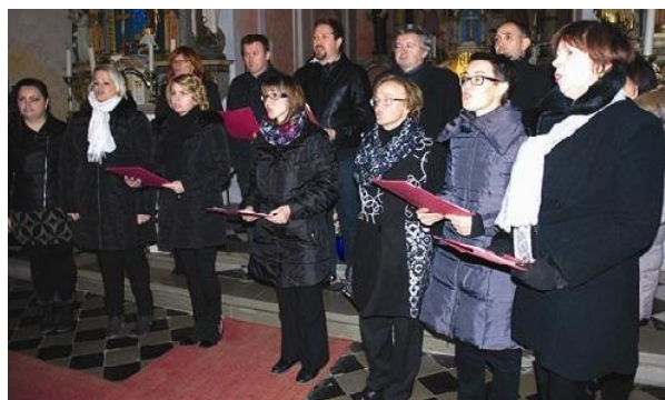
Slika 4: Mešani pevski zbor Laporje