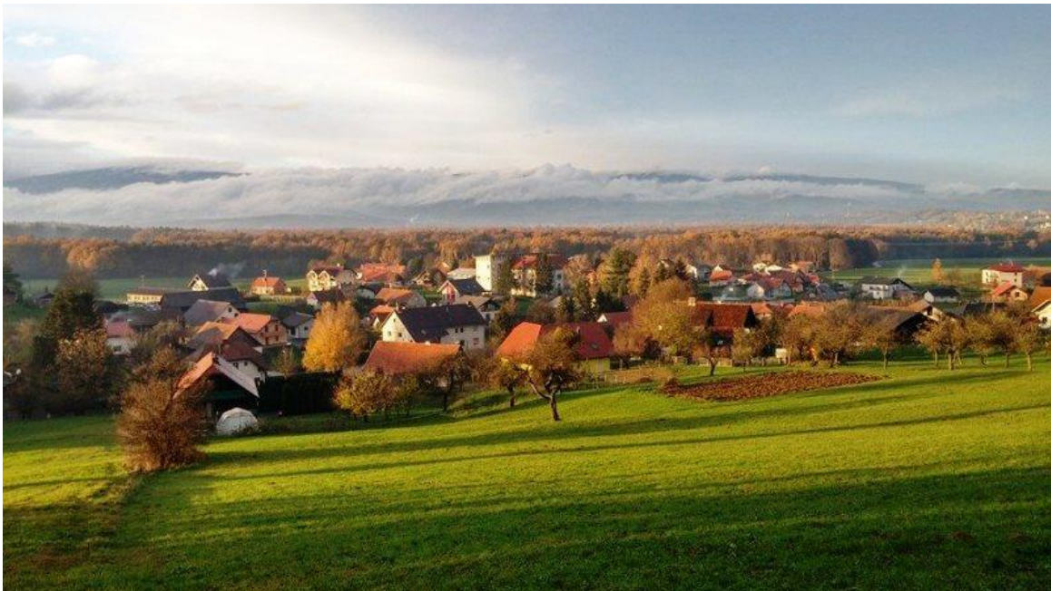
Slika 2: Pogled na Laporje

Laporje je gručasto in deloma razloženo naselje, ki leži na prehodu iz Dravinjske v Ložniško dolino. Leži na nadmorski višini 275 m. Je osrednje naselje istoimenske krajevne skupnosti, ki obsega Dolgi Vrh, Drumlažno, Hošnico, Ješovec, Kočno ob Ložnici, Križni Vrh, Levič, Razgor, Žabljek, Vrhole pri Laporju in Zgornjo Brežnico. Laporje je bogato z naravnimi in kulturnimi znamenitostmi. Ponaša se tudi z bogato zgodovino. V pisnih virih je prvič omenjeno že leta 1251 kot Lapriach. (Čas, 2008) Sredi vasi stoji osnovna šola Gustava Šiliha Laporje , ki nosi ime pedagoga Gustava Šiliha in je bila zgrajena leta 1906. Ker stari prostori niso več zadostovali za pouk, so leta 2000 dogradili prizidek, ki omogoča kvalitetno delo otrokom v vrtcu, učencem in vsem zaposlenim. Je tudi središče kulturnega in športnega življenja. (Čas, 2008) Cerkev sv. Filipa in Jakoba je osrednji kulturni spomenik v Laporju. Kot župnija je prvič omenjena leta 1395. Na južni strani cerkve je vzidan žrtvenik, posvečen rimskemu bogu Marsu. Notranja oprema cerkve je bogata. Glavni oltar je delo Jožefa Holzingerja, več ostalih kipov pa je delo Jožefa Strauba. Sedanjo cerkev iz leta 1374 so prezidali leta 1907. (Čas, 2008)