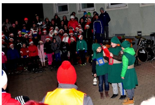
Slika 3: Šolska prireditev ob božičnem sejmu